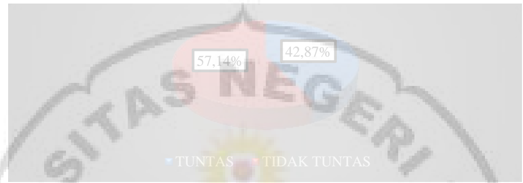
Gambar 4.1 Diagram Ketuntasan Hasil Belajar Siswa Siklus I

Selanjutnya hasil pembelajaran ini akan dijadikan sebagai acuan untuk memperbaiki proses pembelajaran pada siklus II untuk mengatasi kesulitan yang dialami siswa pada saat proses pembelajaran.