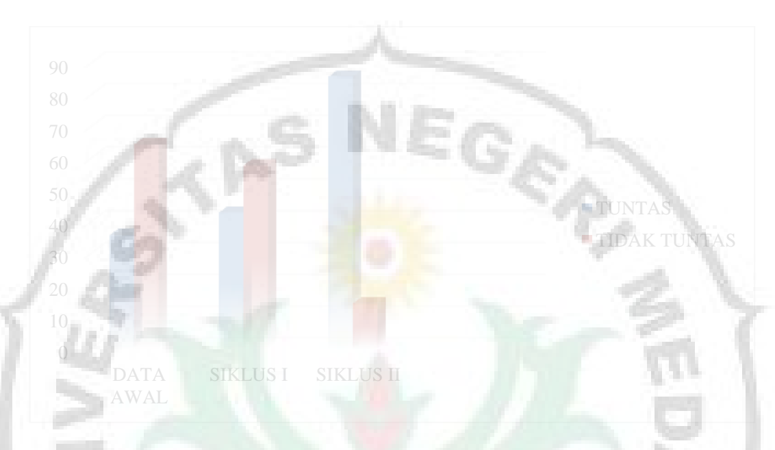
Gambar 4.3. Diagram Perbandingan Hasil Belajar Senam Lantai Guling Depan Melalui Pembelajaran Menggunakan Media Audiovisual Dari Data Awal, Siklus I dan Siklus II

Berdasarkan gambar diagram diatas dapat dijelaskan dari data awal hasil belajar senam lantai guling depan dari 28 siswa yang mencapai nilai ketuntasan sebanyak 10 siswa sedang 18 siswa yang lain belum mencapai nilai ketuntasan. Pada pembelajaran siklus I jumlah siswa yang mencapai nilai ketuntasan sebanyak 12 orang siswa dan 16 siswa yang lainya belum mencapai nilai ketuntasan. Pada mengikuti proses pembelajaran guling depan 24 siswa sudah mencapai nilai etuntasan pembelajaran sedangkan 4 siswa lainya belum mencapai nilai