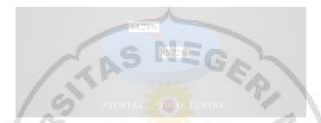
Gambar 4.2 Diagram Ketuntasan Hasil Belajar Siswa Siklus II