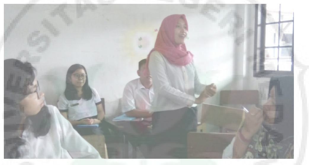
Gambar 7. Mahasiswa Mengeluarkan Pendapat dan Tanggapan

Pada pertemuan selanjutnya para mahasiswa menampilkan hasil diskusi dengan tidak melihat teks atau lembar kerja yang mereka buat. Hanya membawa teks cerita saja. Sedangkan para mahasiswa yang lemah dalam berbicara diberikan kesempatan pertama untuk menampilkan diskusi dan dan memberikan suatu tanggapan. Hal ini dimaksud agar mahasiswa itu mampu dalam berbicara.