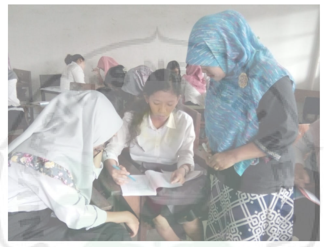
Gambar 6. Dosen Membimbing Mahasiswa Dalam Berdiskusi