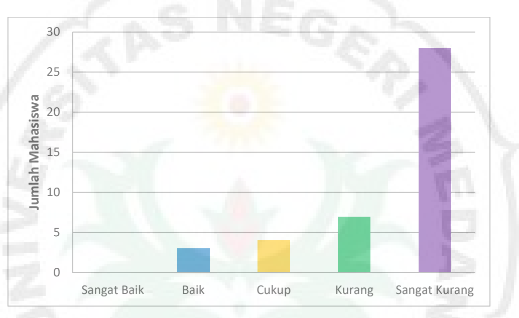
Diagram 1. Hasil Kemampuan Berbicara Mahasiswa Siklus I Pertemuan I

Dari rata-rata di atas dapat dikatakan bahwa tingkat kemampuan berbicara mahasiswa masih sangat kurang. Hal itu terlihat karena hanya ada 3 orang mahasiswa yang memiliki kemampuan berbicara yang baik yaitu 7,14 %. Hasil persentase rata-rata indikator lembar observasi adalah: