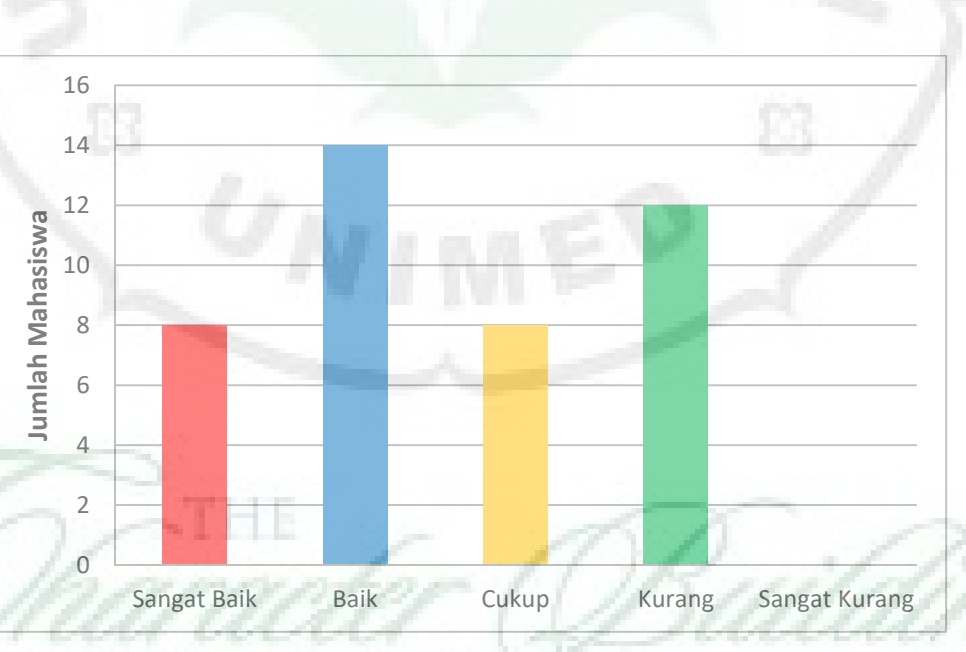
Siklus I Pertemuan II