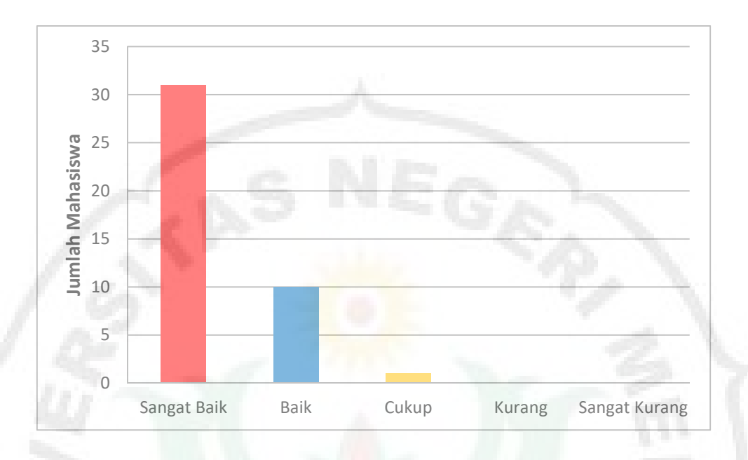
Diagram 4. Hasil Kemampuan Berbicara Mahasiswa Siklus II Pertemuan II

Dari rata-rata kelas di atas dapat dikatakan bawah tingkat kemampuan berbicara mahasiswa dikatakan sangat baik. Hal itu terlihat ada 41 orang siswa yang memiliki Kemampuan berbicara sangat baik dan baik. Atau sekitar 97,61%. Dari 10 indikator Kemampuan berbicara, sudah hampir seluruh indikator dapat tercapai dalam diri mahasiswa pada pokok bahasan menanggapi berita faktual. Hasil persentase rata-rata indikator lembar observasi adalah: