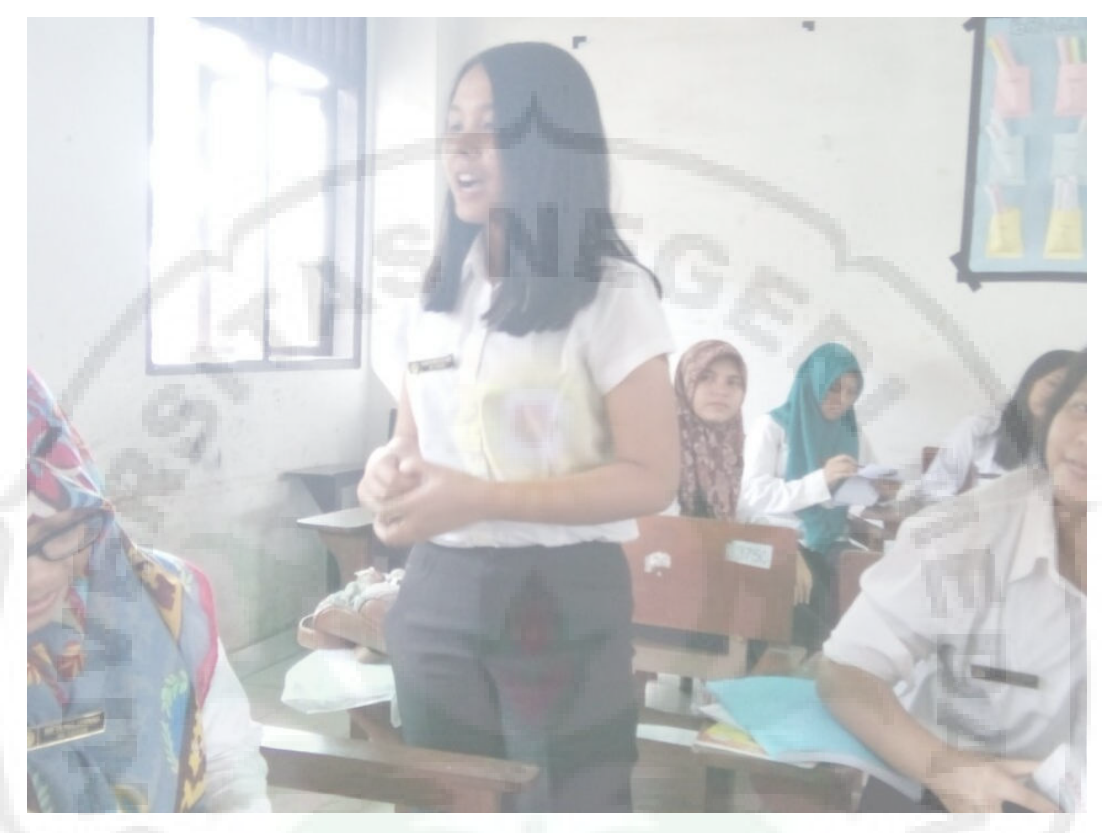
Gambar 5. Mahasiswa Menanggapi Hasil Diskusi Kelompok