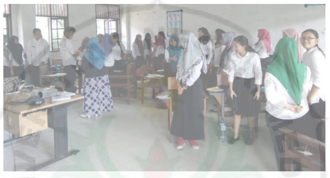
Gambar 2. Dosen membagi Kelompok Diskusi

memudahkan peneliti untuk menilai kemampuan berbicara mahasiswa dan mengamati proses belajar mengajar dengan menggunakan metode diskusi.