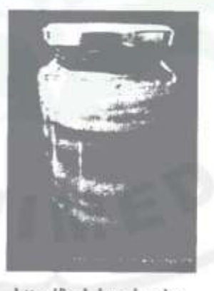
http://indokombucha. wordpress.com (b)