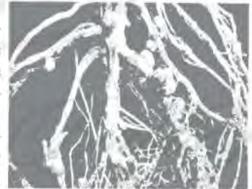
Gambar 5.1. Bintil pada akar kacang tanah

Nodulasi dan fiksasi nitrogen tergantung pada kerjasama dari faktor-faktor yang berbeda yaitu kehadiran strain Rhizobium yang efektif pada sel akar, peningkatan jumlah sel Rhizobium di rizosfer, infeksi akar oleh bakteri, pertumbuhan, dan aktivitas Rhizobium itu sendiri. Pelekatan Rhizobium pada rambut akar juga dapat terjadi karena pada permukaan sel Rhizo-