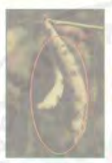
sumber, http://www.extension.umn.adu (a)