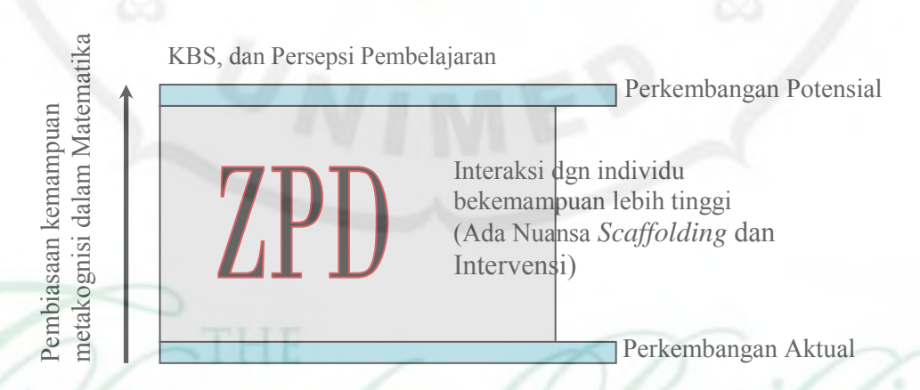
Gambar 1. Pengembangan KBS, dan Persepsi terhadap Pembelajaran

Melalui pembelajaran dengan pendekatan metakognitif dalam pembelajaran matematika faktor kebiasaan berpikir tentang pikiran yang dilatih oleh guru dan peneliti dalam matematika, masalah kontekstual, bahan ajar, aktivitas diskusi akan saling bertalian dalam mempengaruhi Pengembangan Kemandirian Belajar siswa (KBS), serta persepsi terhadap pembelajaran. Keterkaitan tersebut diilustrasikan sebagai berikut.