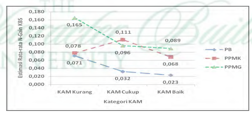
Gambar 4 Interaksi antara Pendekatan Pembelajaran dengan KAM terhadap Peningkatan Kemandirian Belajara Siswa

Hasil pengujian hipotesis terdapat perbedaan peningkatan KBS yang signifikan berdasarkan pendekatan pembelajaran. Disamping itu tidak terdapat perbedaan peningkatan kemandirian belajar siswa (KBS) yang signifikan ditinjau dari perbedaan KAM dan tidak ada interaksi yang signifikan antara pendekatan pembelajaran dengan KAM terhadap peningkatan KBS. Hal ini diartikan bahwa interaksi pendekatan pembelajaran dengan KAM tidak menghasilkan perbedaan peningkatan KBS. Gambar 4 berikut dapat lebih memperjelas tidak adanya interaksi antara KAM dengan pendekatan pembelajaran terhadap peningkatan KBS.